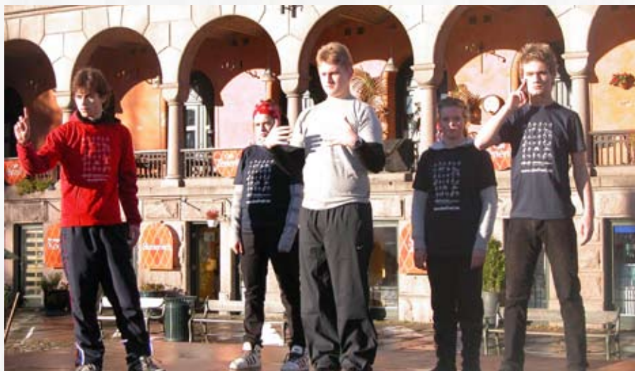
Ungdomsgruppen til Teater Manu imponerte med en feiende flott forestilling om tegnspråk og talespråk, om døve og hørende – og konklusjonen: vi trenger hverandre på tvers av språk og hørsel.