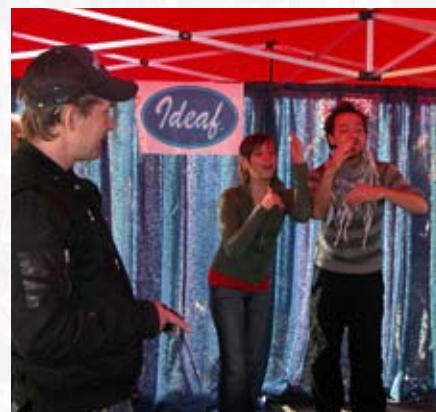
Folk fikk prøve seg foran tv-kamera i «Ideaf», der en fremførte tegnspråkpoesi til rytmer.