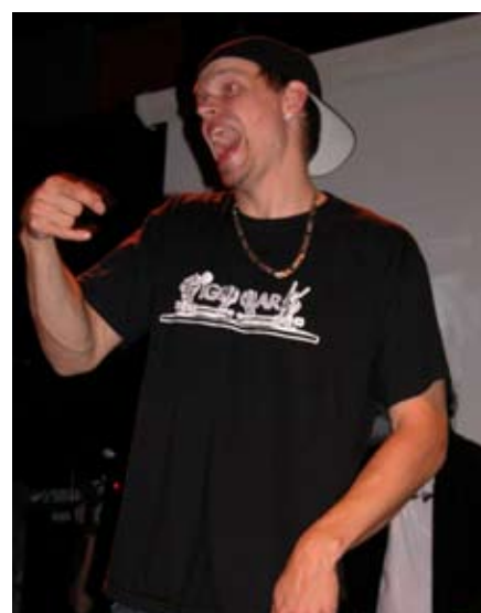
Marko «Signmark» Vuoriheimo.