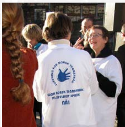
Det var mange t-skjorter med helt klare budskap!